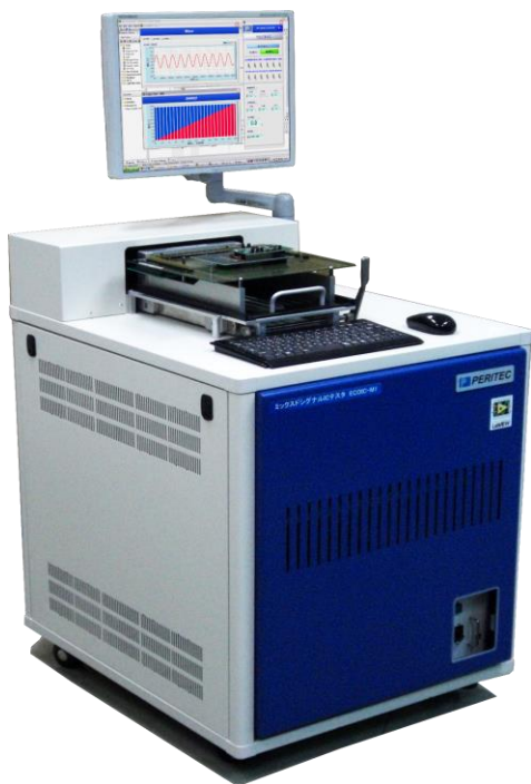
スタンダードタイプ